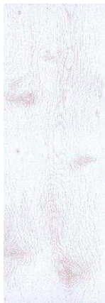
D2951 Dub bílý

obytné prostory, pokoje, ložnice, kuchyně, předsíně, šatny a chodby laminátová plovoucí podlaha PREMIUM, tl.7 mm, zátěžová třída 31