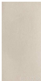
DAKSE 611 šedá