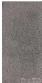
DAKSE 612 šedohnědá