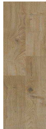
D5263 Dub přírodní