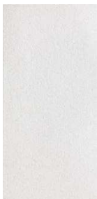
DAKSE 610 béžová