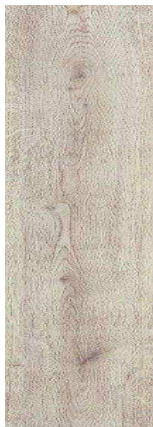
D3126 Dub šedý