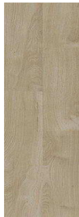
D5261 Dub zimní